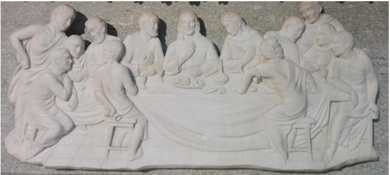
Ultima Cena, particolare della mensa nella nostra chiesa

CELEBRAZIONE VESPERTINA NELLA CENA DEL SIGNORE