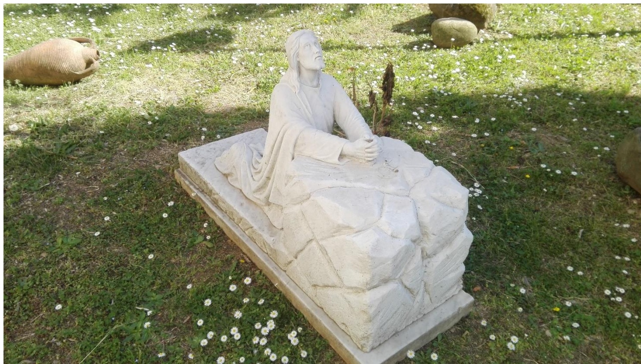
Gesù prega nell'orto degli ulivi, scultura nel giardino di fianco alla chiesa